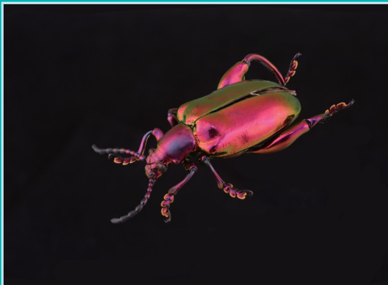
フェモラータオオモモトハムシ