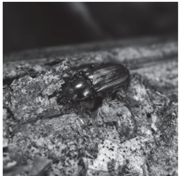
埼玉県にゆかりのある構造色昆虫チブコルリクワガタ