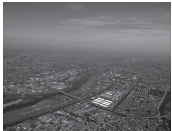
彩湖上空 埼玉から東京へ