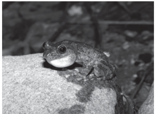
鳴いているカジカガエルのオス (小川町)