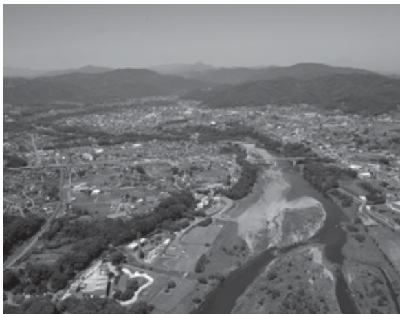
かわはくとかわせみ河原（2016年）