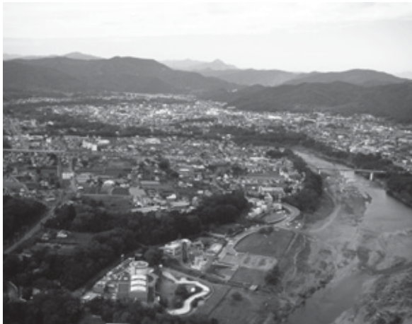
かわはくとかわせみ河原（2007年）