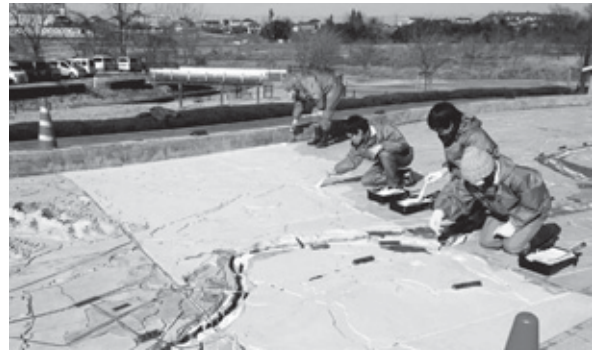
美しく甦る大模型に仕上塗りの手も軽やか…