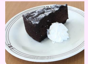
チョコレートケーキ 400円