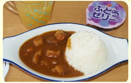
お子さま カレーセット 500円 オレンジジュース ぶどうゼリー付