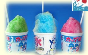
メロン ブルーハワイ いちご 各 300円