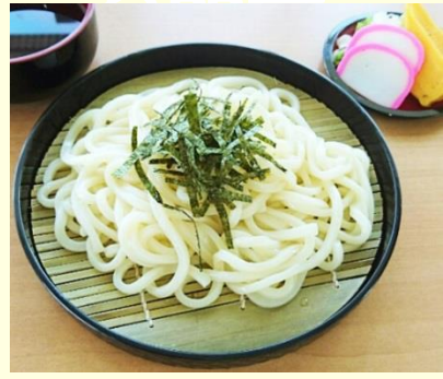
冷やしざるうどん 550円