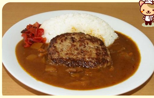
ハンバーグカレー 800円