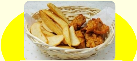
からあげ&ポテトセット 500円