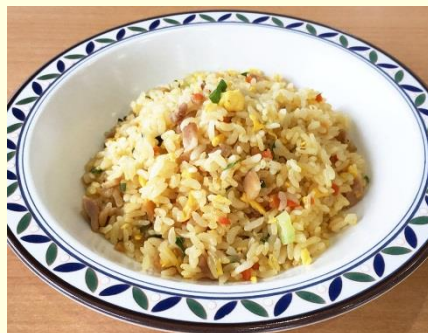
五目チャーハン 550円