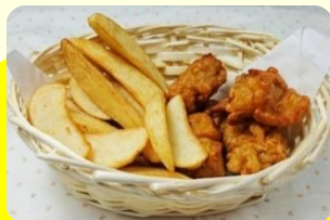
からあげ&ポテト 500円