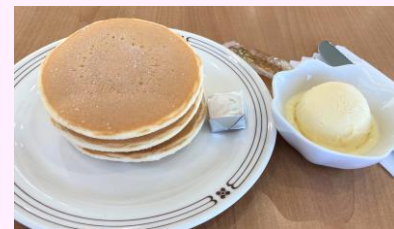
ホットケーキセット バニラアイス・ソフトドリンク付