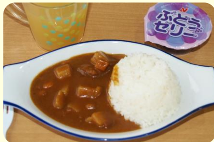
お子さま カレーセット 500円

クルマ・バイク・自転車等を運転・利用される方、20歳未満の方の飲酒は禁止されています。ご遠慮ください。