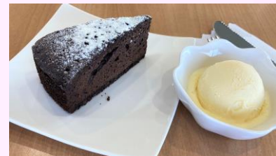
チョコケーキセット バニラアイス・ソフトドリンク付