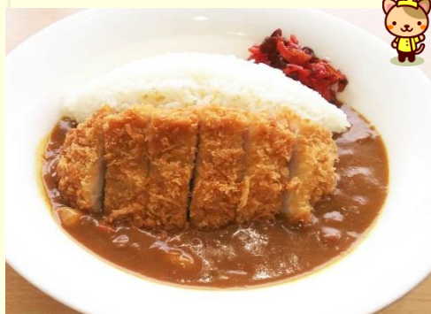
三元豚のポークカツカレー 850円