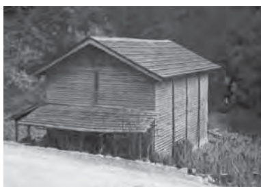
横瀬町大畑にあった氷倉