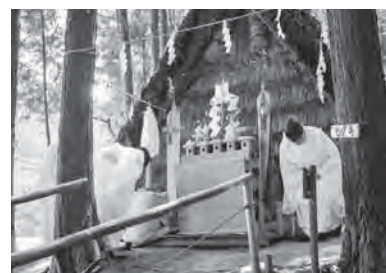
復元氷室での福住氷まつり