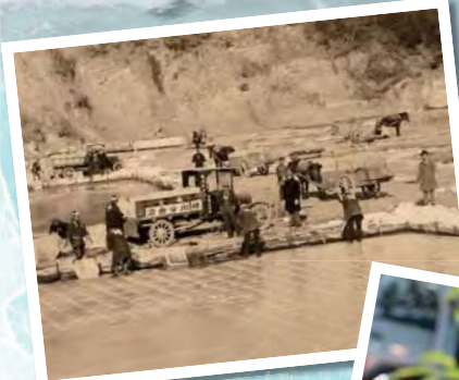
横瀬川での製氷作業 (昭和初期)