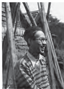
軽井沢・氷室前の堀辰雄