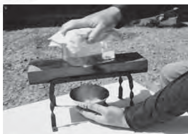
氷削り鉋