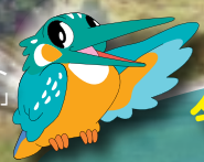
川の博物館マスコット 「カワシロウ」