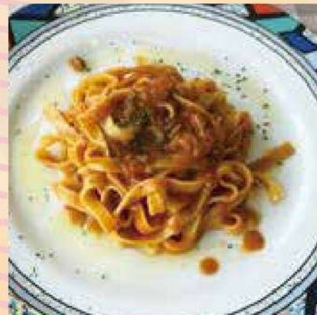
Fresh Pasta Creamy Bolognese