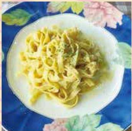
Fresh pasta carbonara