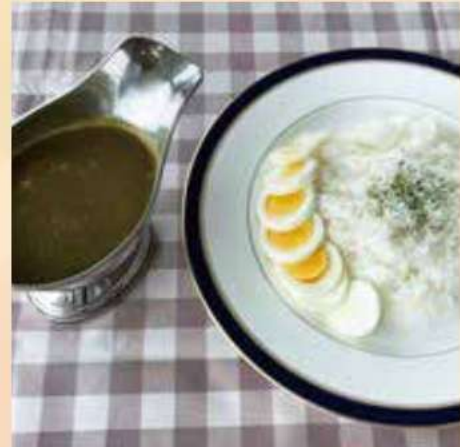
Spinach and chicken curry