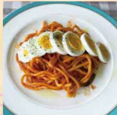
Chewy Showa Neapolitan