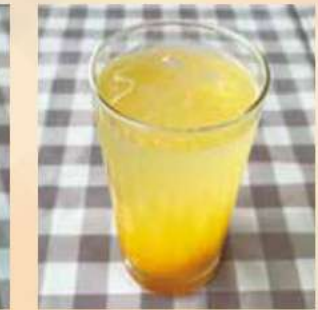
Elder Yorii mandarin orange soda