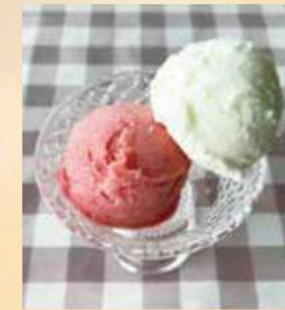
Hana's Chichibu gelato (double)