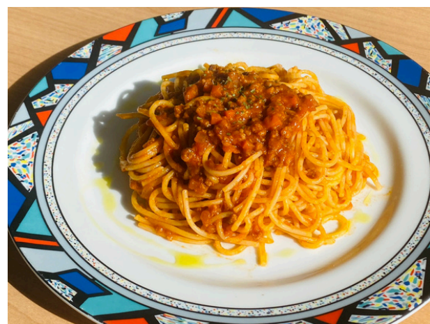
季節のパスタ ¥1150 (ミートソース)