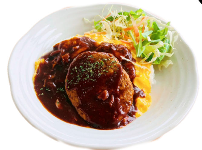
トロたまココモコ丼 ¥1100