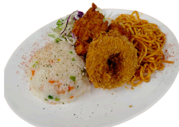
ウォーターミルス ¥1550