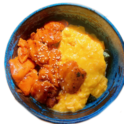
炭火焼き鳥トロたま丼 ¥1100